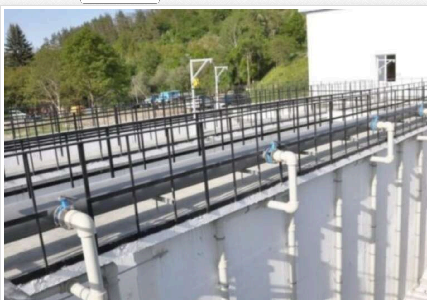
У Заліщиках на Тернопільщині реконструюють очисні споруди за 46 мільйонів гривень за завищеною ціною

КП «Заліщицький водоканал» (Тернопільська обл) 23 квітня за результатом торгів уклало договір із ТОВ «Спецвогнезахист» на реконструкцію очисних споруд у місті Заліщиках на суму 46,10 млн грн.