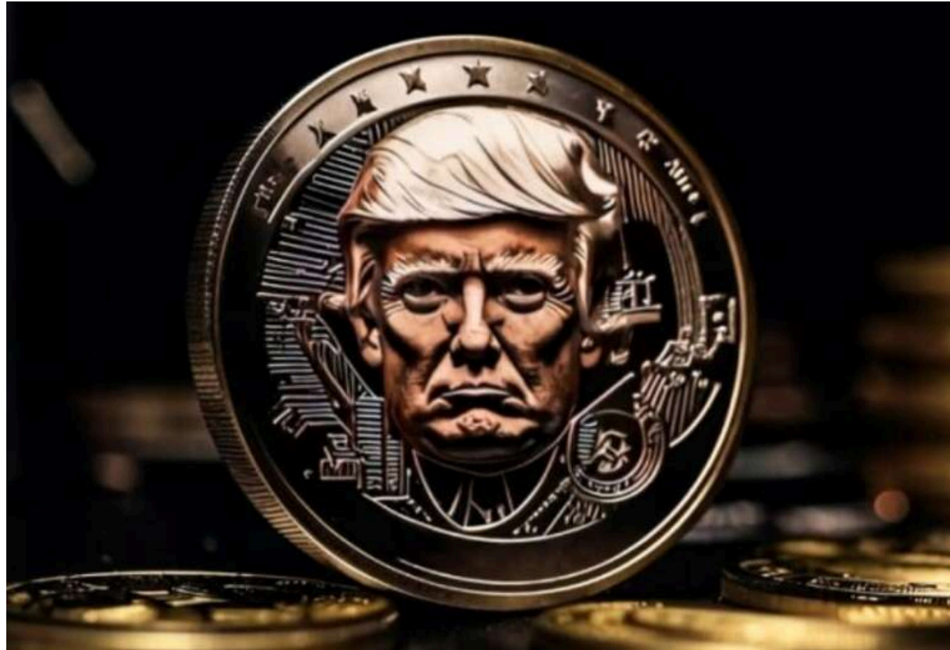
Трамп заперечує, що отримує прибуток від токена TRUMP, але готується до гала-вечері з його власниками

Президент США Дональд Трамп заявив, що не отримує прибутку від криптовалюти під назвою TRUMP і «не слідкує за цим», про що він повідомив в інтерв'ю.