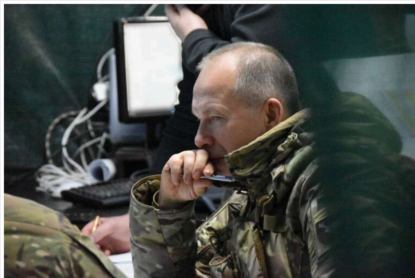
Курська операція за 9 місяців досягла більшості поставлених цілей, - Сирський

Читати на російськом | Read in English | Додати як бажане джерело в Google