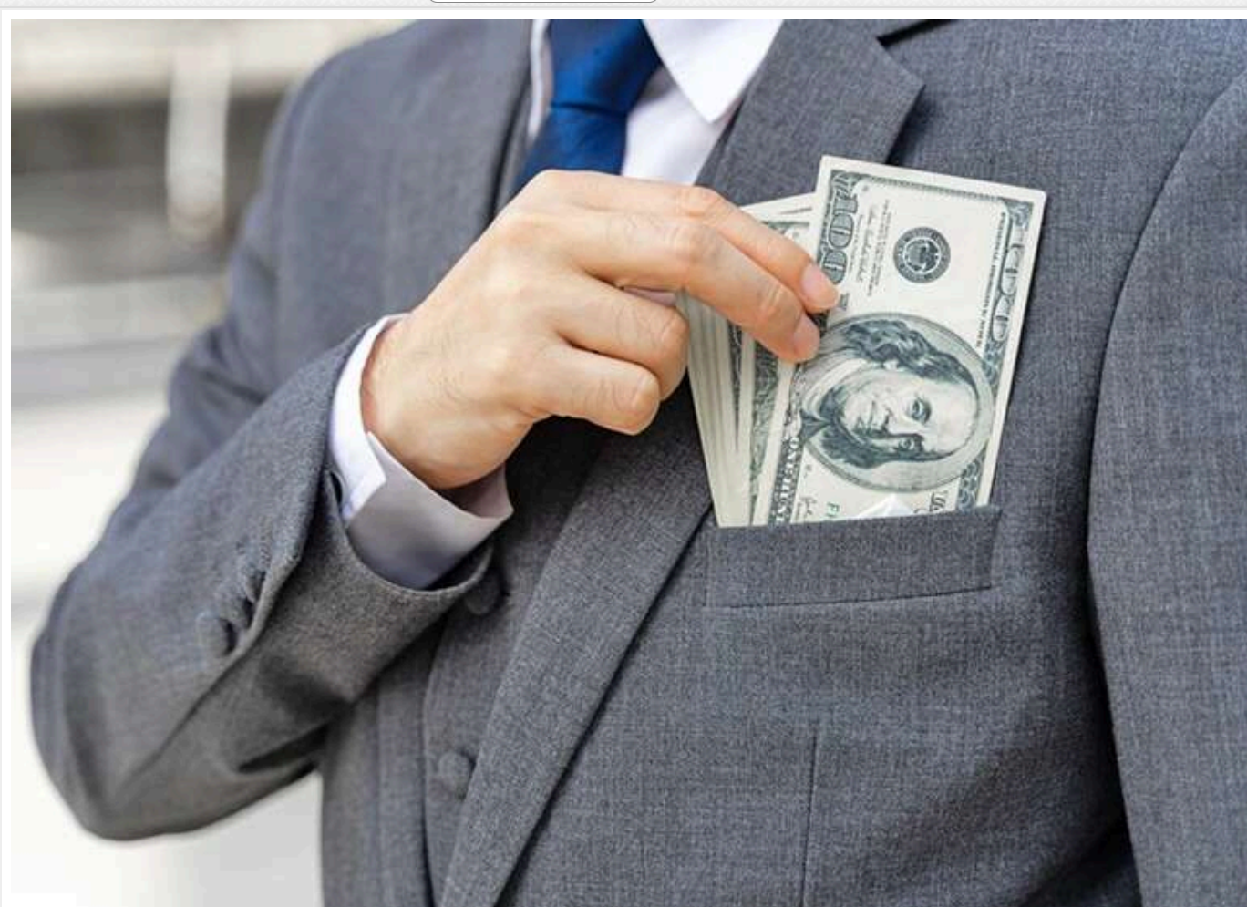
В Україні різко зросла кількість мільйонерів - аж на 63%,- ДПС

Читати на русском Read in English Додати як бажане джерело в Google