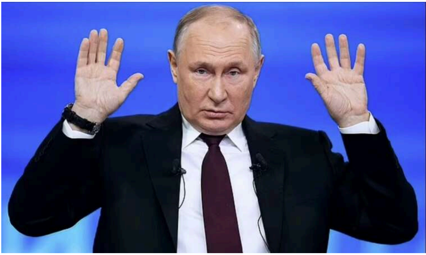
Путін уперше заговорив про наступника: що стоїть за несподіваною заявою?

Чому Путін раптом заговорив про спадкоємця — на тему, яка в Росії була жорстко табуована?