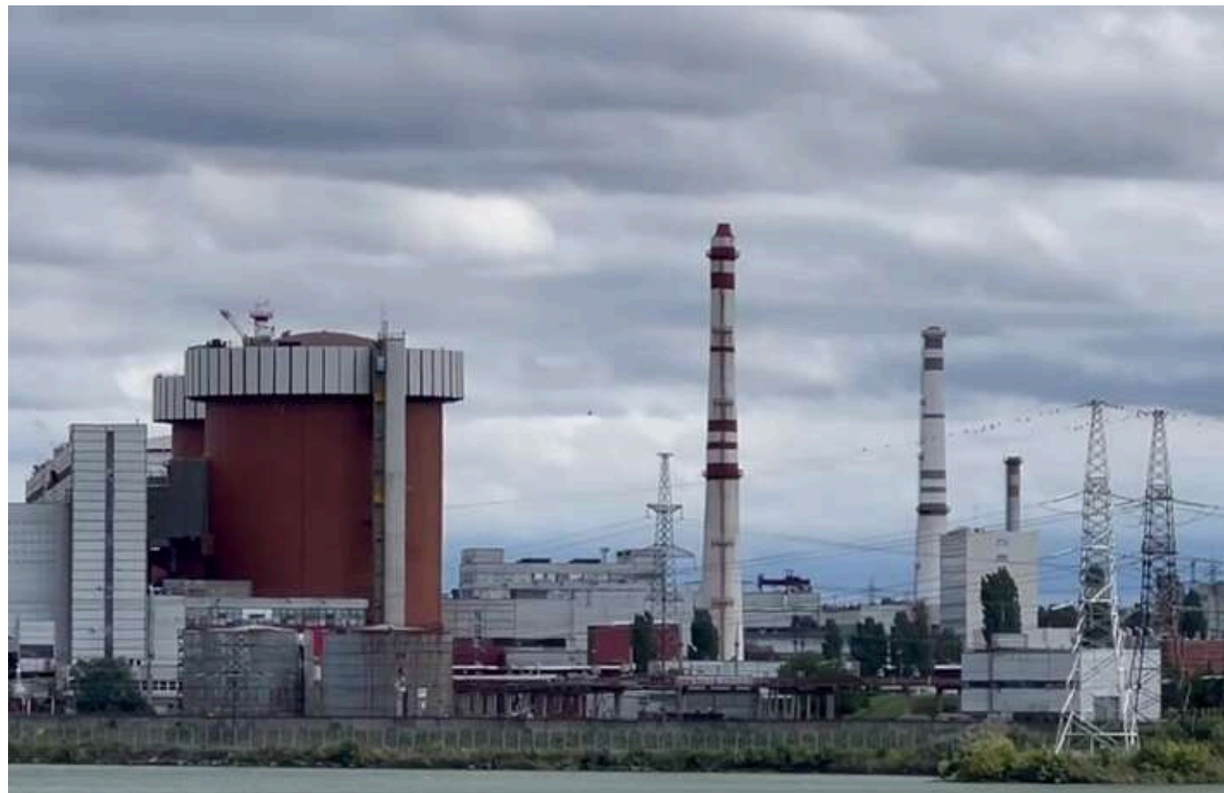
Махінації на "Південноукраїнській АЕС": посадовці та бізнесмени підозрюються у привласненні понад 12 мільйонів гривень

Читати на руськом Read in English Додати як бажане джерело в Google