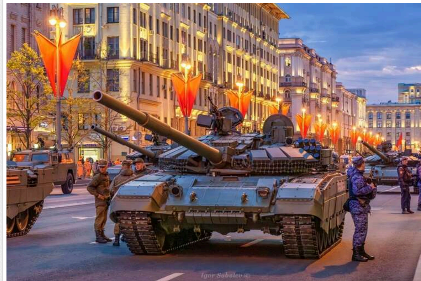
У Москві глушать мобільний зв'язок та інтернет через парад

У Росії 5 травня відбувається репетиція параду, який відбудеться 9 травня. Росіяни скаржаться на виниклі через це проблеми.