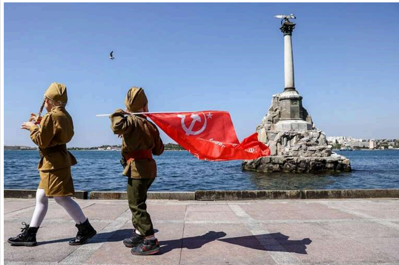
В окупованому Севастополі відмовилися від проведення військового параду

У Севастополі й цього року не планується проведення параду на 9 травня «з міркувань безпеки», повідомили представники окупаційної адміністрації.