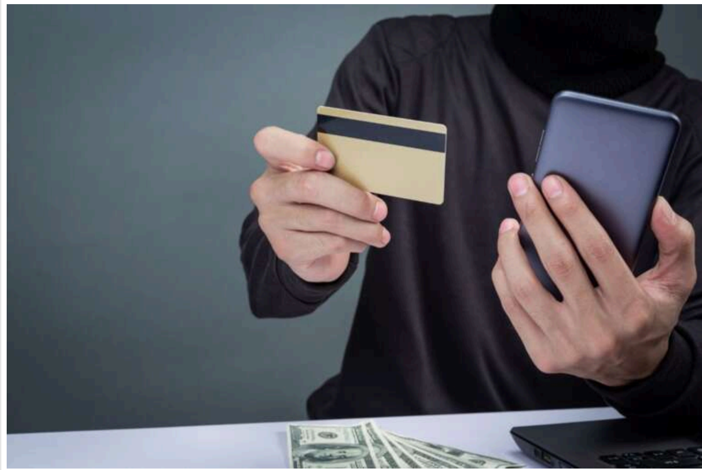
Телефонують зі служби безпеки банку: що робити і як не втратити гроші

Перебуваючи в транспорті отримала дзвінок від працівника банку, який повідомив, що з його рахунку намагаються зняти кошти та перевести на сумнівну картку, терміново необхідно назвати номер своєї картки, термін дії та код для ідентифікації та зупинки транзакції.