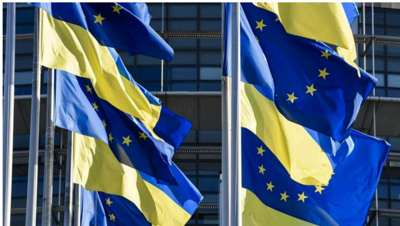
В Євросоюзі представили план допомоги ЗСУ, якщо Трамп не зупинить Путіна

Якщо мир в Україні буде під загрозою, Євросоюз збільшить інвестиції в українських виробників зброї. Це дозволить щонайменше вдвічі збільшити обсяг постачання ЗСУ озброєння.