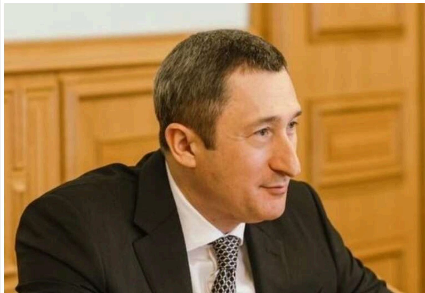
До кінця цього року буде готовий закон про множинне громадянство в Україні, – міністр національної єдності Чернишов

Читати на руськом Read in English Додати як бажане джерело в Google