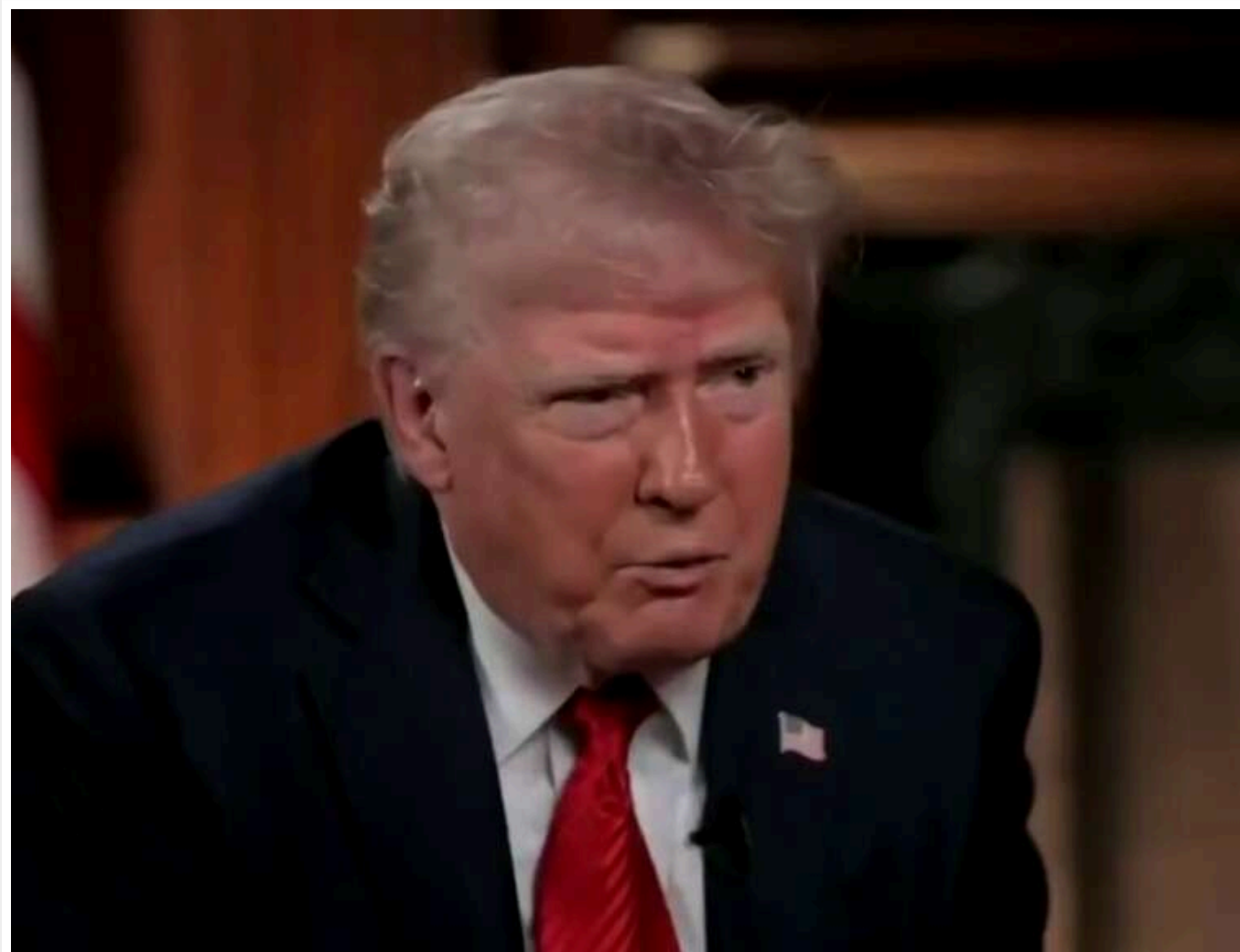
Мирна угода для завершення війни в Україні стає ближчою, - Трамп

Він зазначив, що у нас є дуже хороші шанси для цього.