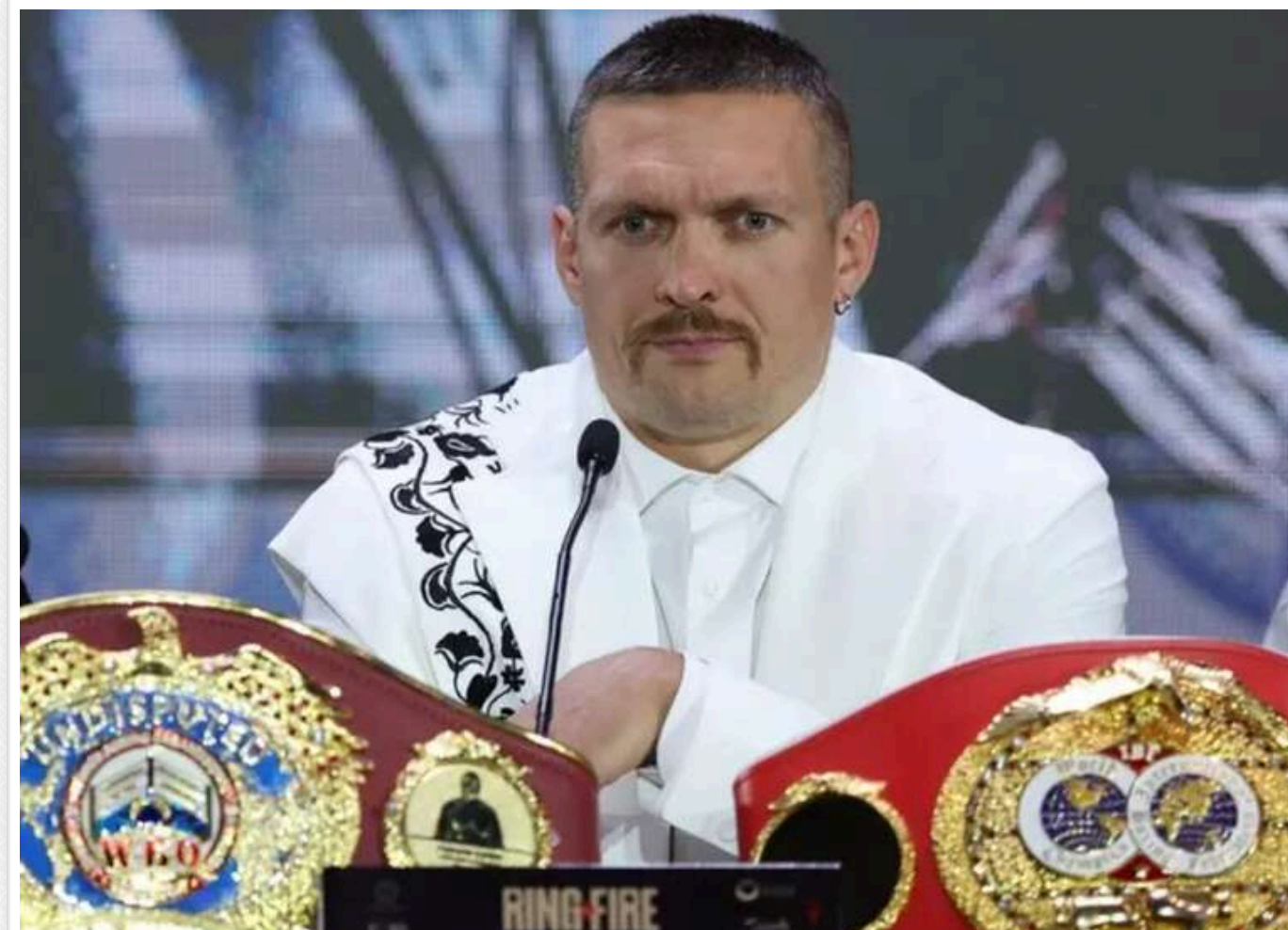
«Путін і Гітлер схожі - ракети летять не по армії, а по дітях і бабусях», - Олександр Усик

Чемпіон світу з боксу у надважкій вазі за версіями WBC, IBO, WBA та WBO Олександр Усик висловив свої думки про російського диктатора Володимира Путіна.