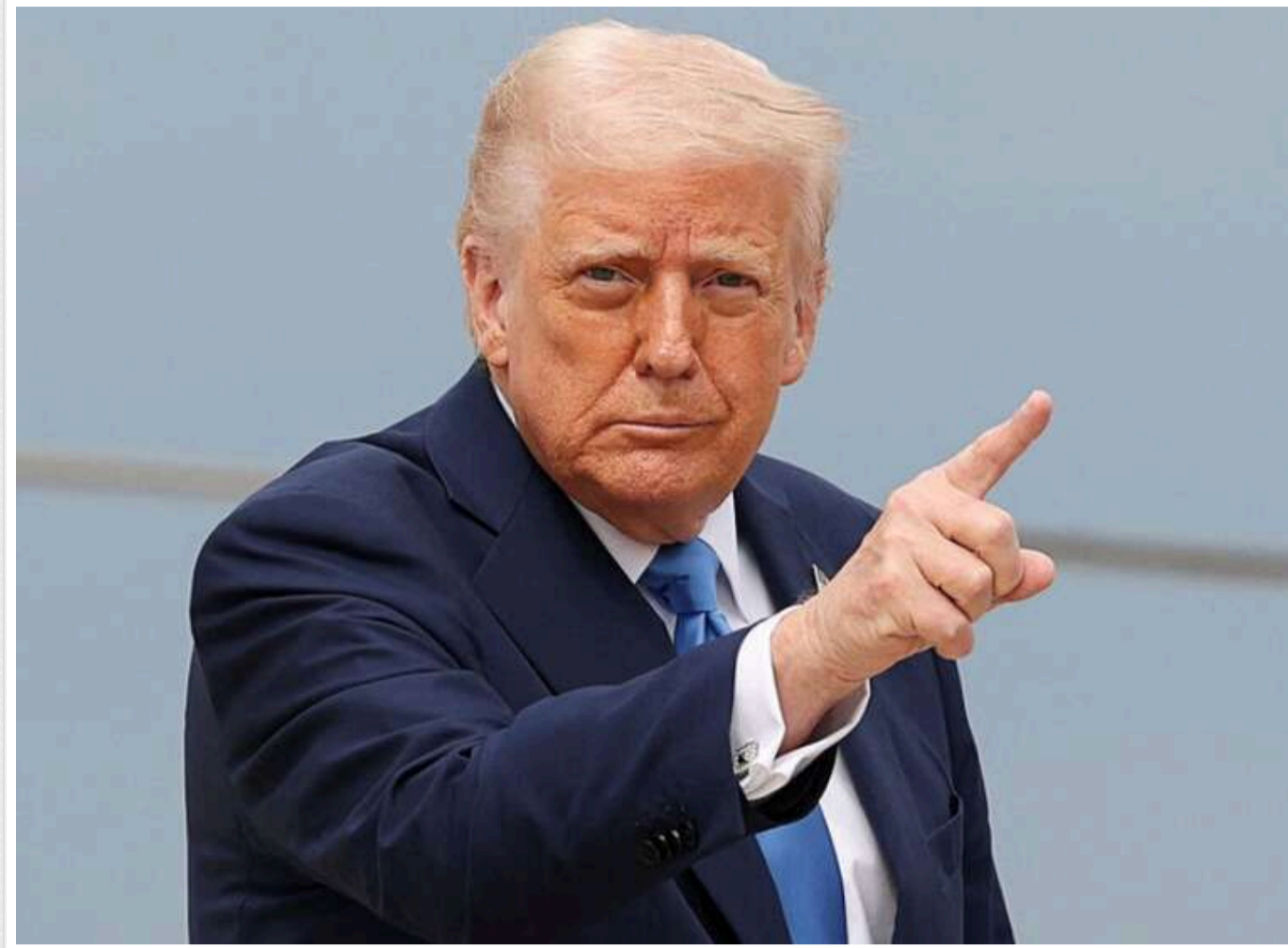
Трамп передумав іти на третій термін і назвав можливих наступників серед республіканців

Президент США Дональд Трамп заявив, що не планує балотуватися на третій термін, попри попередні натяки на таку можливість. У новому інтерв'ю програми Meet the Press на телеканалі NBC Трамп підтвердив, що має намір залишити Білий дім після другого терміну, якщо переможе на виборах 2024 року.