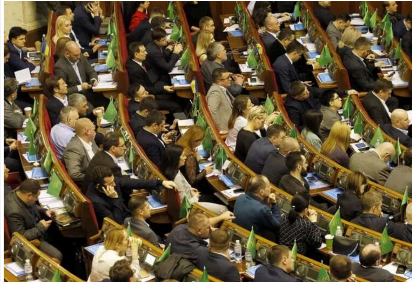
Україна вже цього тижня може ратифікувати угоду зі США

Читати на руском Read in English Додати як бажане джерело в Google