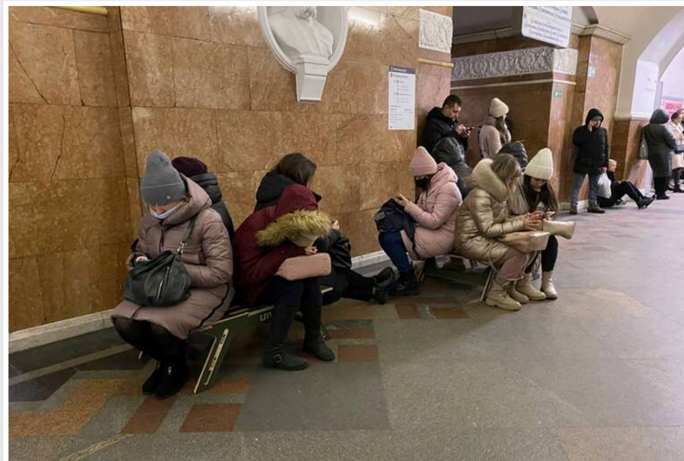
Київський метрополітен закуповує меблі на 1,4 мільйона гривень: більшість – офісні поворотні крісла

Столична підземка планує витратити на меблі майже 1,4 млн грн, більша частина закупівлі - офісні крісла.