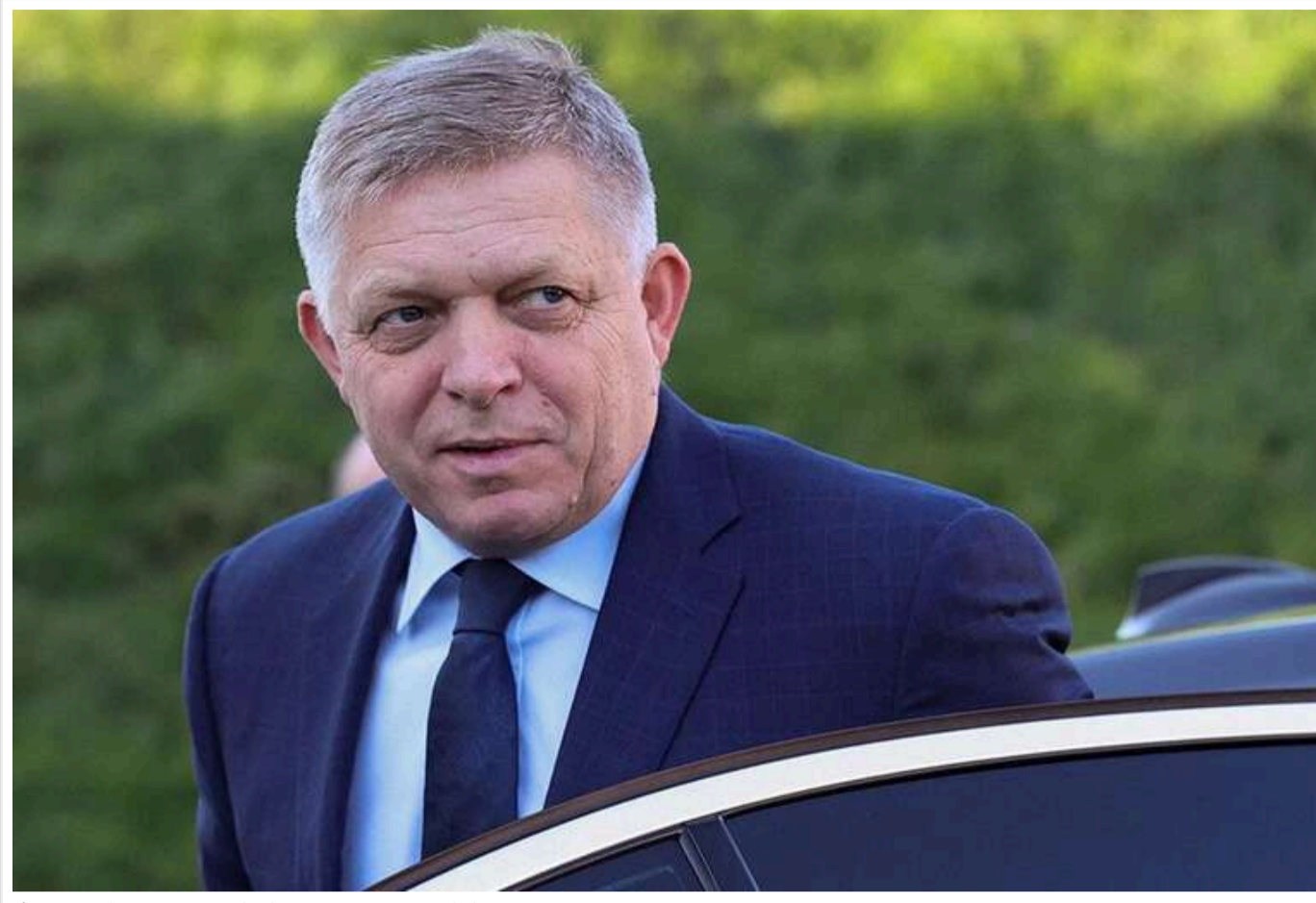
Фіцо повідомив, що поїде до Москви на парад 9 травня

Словацький прем'єр-міністр Фіцо оголосив, що відвідає Москву 9 травня.