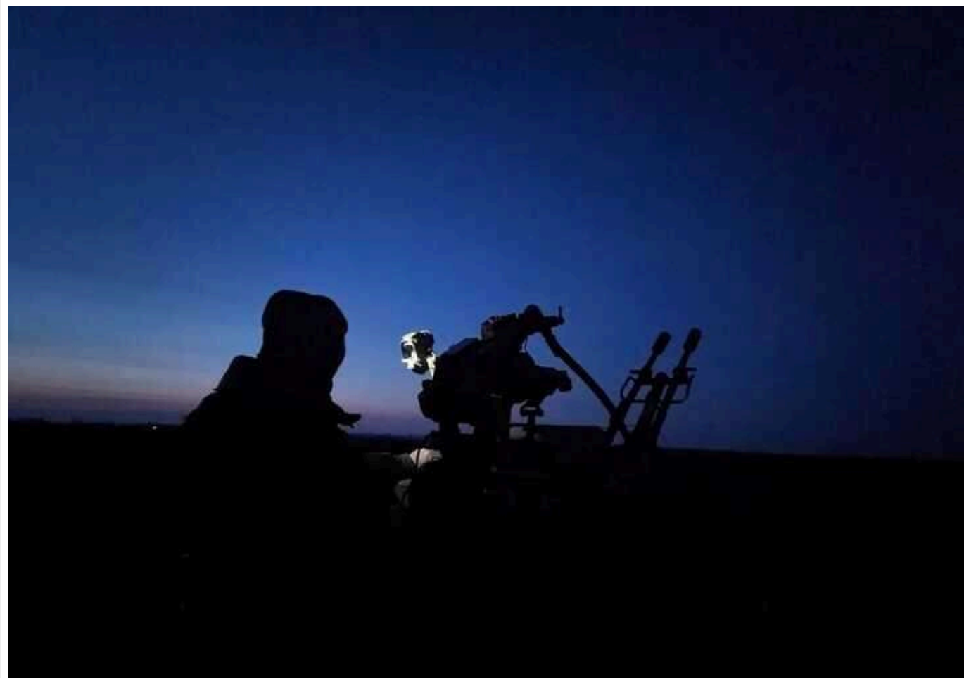
Росія вночі атакувала Україну понад 150 дронами: вночі збили 69 "шахедів", постраждали п'ять областей

Читати на руськом Read in English Додати як бажане джерело в Google