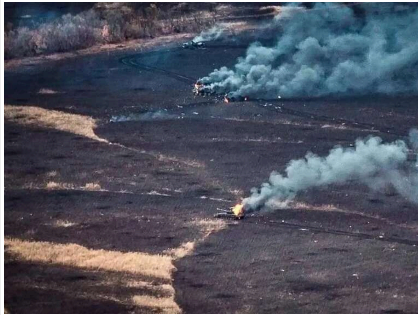
Втрати ворога за добу: ЗСУ відмінували 1340 окупантів та 2 літаки

Читати на руськом Read in English Додати як бажане джерело в Google