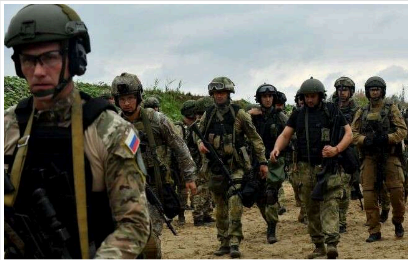
На Херсонському напрямку втекли з позицій 12 військових РФ, – "АТЕШ"

Читати на руськом Read in English Додати як бажане джерело в Google