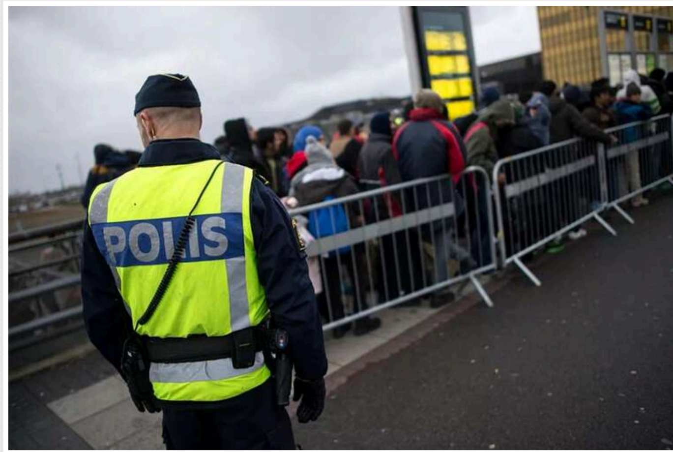
В Швеції мігрантам можуть платити по 32 тисячі євро, якщо вони вирішать повернутися додому

Швеція планує підвищити виплати мігрантам за повернення додому з 900 до 32 000 євро. Це пов'язано з наміром Стокгольма встановити контроль над міграцією.