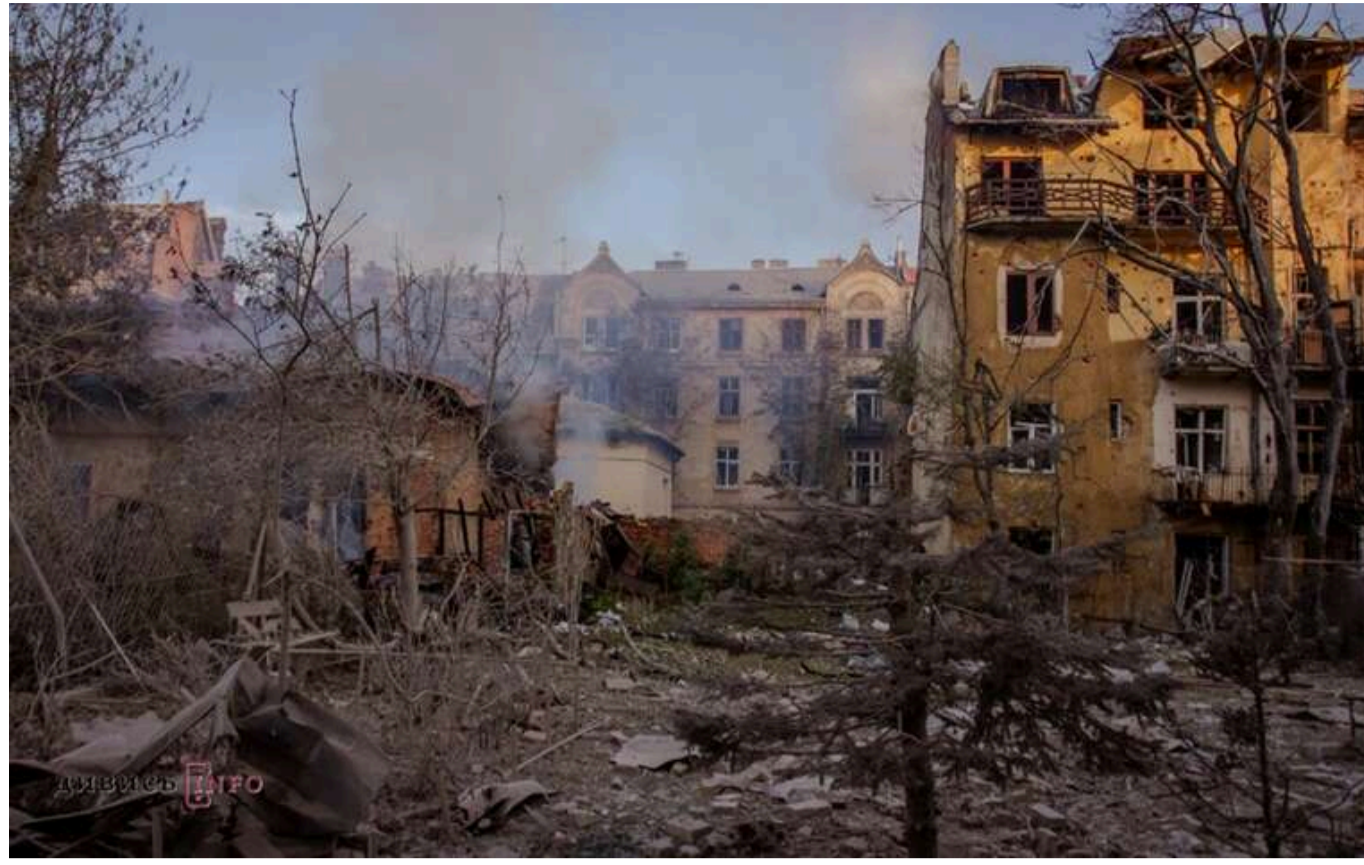
NYT: Після старту переговорів життя в Україні стало небезпечнішим

З початком переговорів щодо припинення вогню у війні між Росією та Україною життя українських мирних жителів стало більш небезпечним.