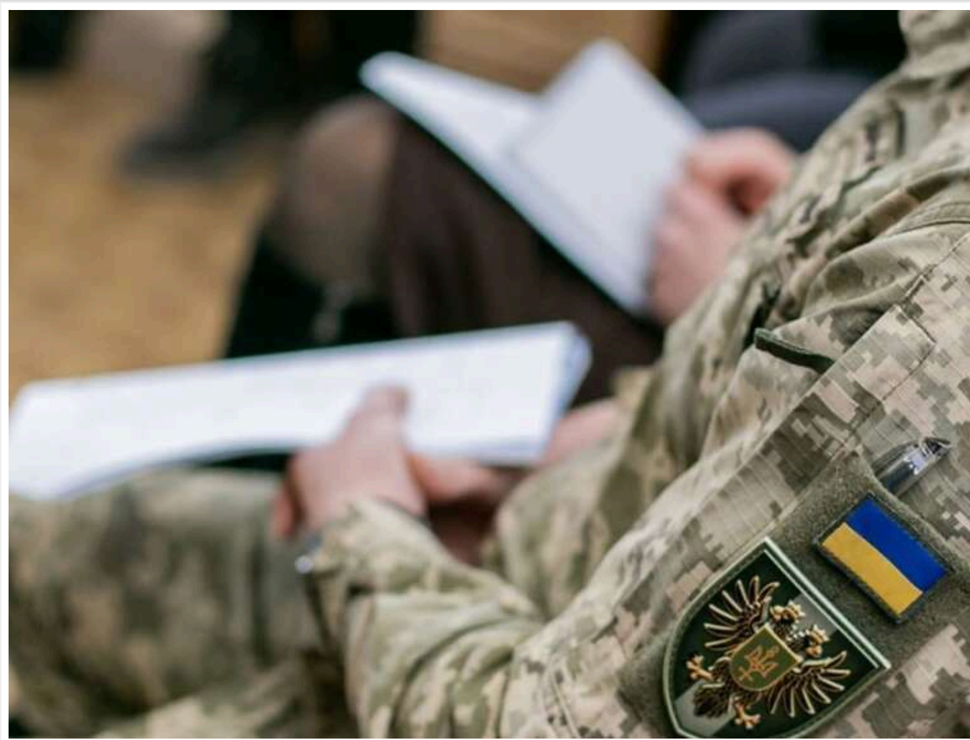
У київському ТЦК чоловіка пристебнули стяжками до ліжка через агресивну поведінку: у військкоматі підтвердили інцидент

За повідомленнями місцевих пабліків, в одному з київських ТЦК чоловіка прив'язали, щоб він не намагався втекти.