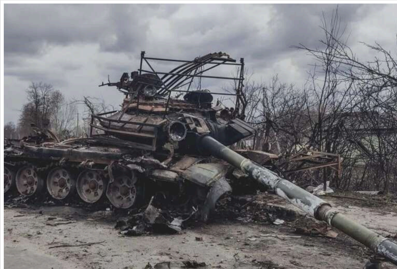
Кожен захоплений кілометр "коштував" Росії життя щонайменше 27 солдатів

Торік Росія зазнала найсерйозніших втрат з початку повномасштабного вторгнення. За підрахунками журналістів і аналітиків, на кожен кілометр захопленої території припадає 27 загиблих окупантів.