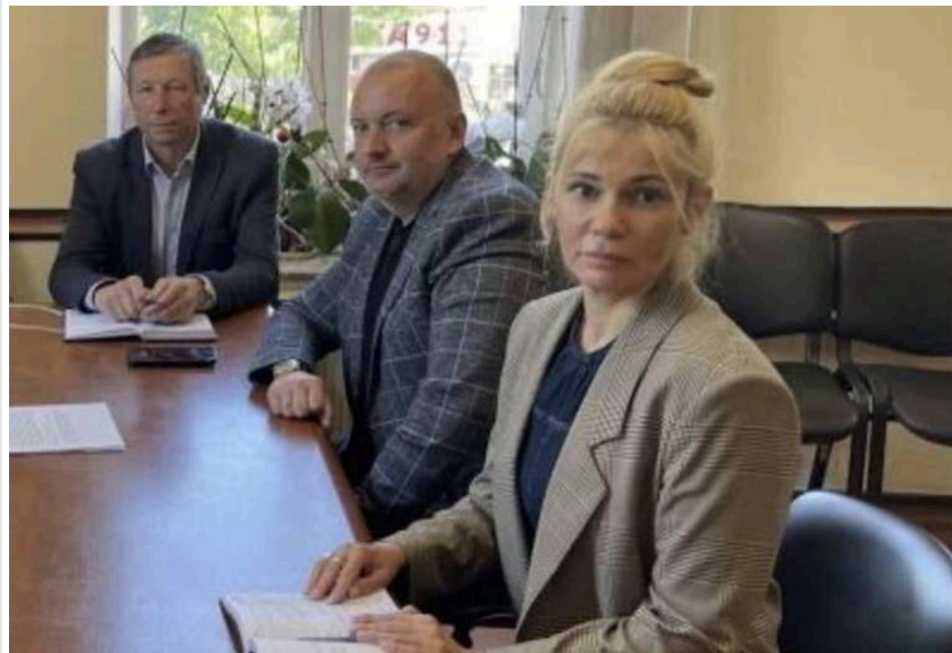
Мати корупціонера з ДМС Одещини купила свердловину з мінералкою за 2 мільйони: згодом зникла зі складу засновників

Читати на руськом Read in English Додати як бажане джерело в Google