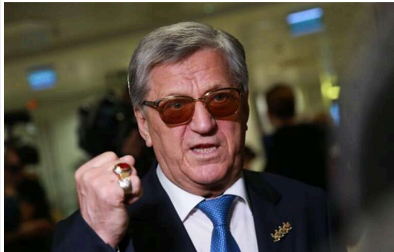
Колишній радянський біатлоніст Тихонов зажадав вибачень у чеського ексхокеїста: «Вибачся, скотина»

Чотириразовий олімпійський чемпіон з біатлону Олександр Тихонов прокоментував лист, опублікований олімпійським чемпіоном з хокею Домініком Гашеком, на адресу Міжнародного олімпійського комітету (МОК) та Міжнародної федерації хокею на льоду (ІІHF).