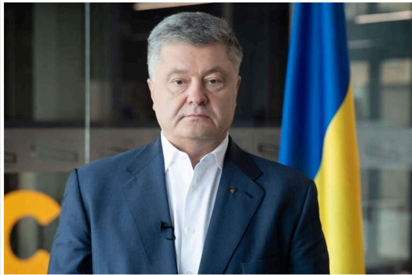
Порошенка визнано потерпілим у справі польської прокуратури - судові документи отримав його адвокат

Кржиопільський районний суд Вінницької області виконав доручення окружної прокуратури Варшава-Прага (Польща) і вручив документи потерпілому, народному депутату та експрезиденту Петру Порошенку.