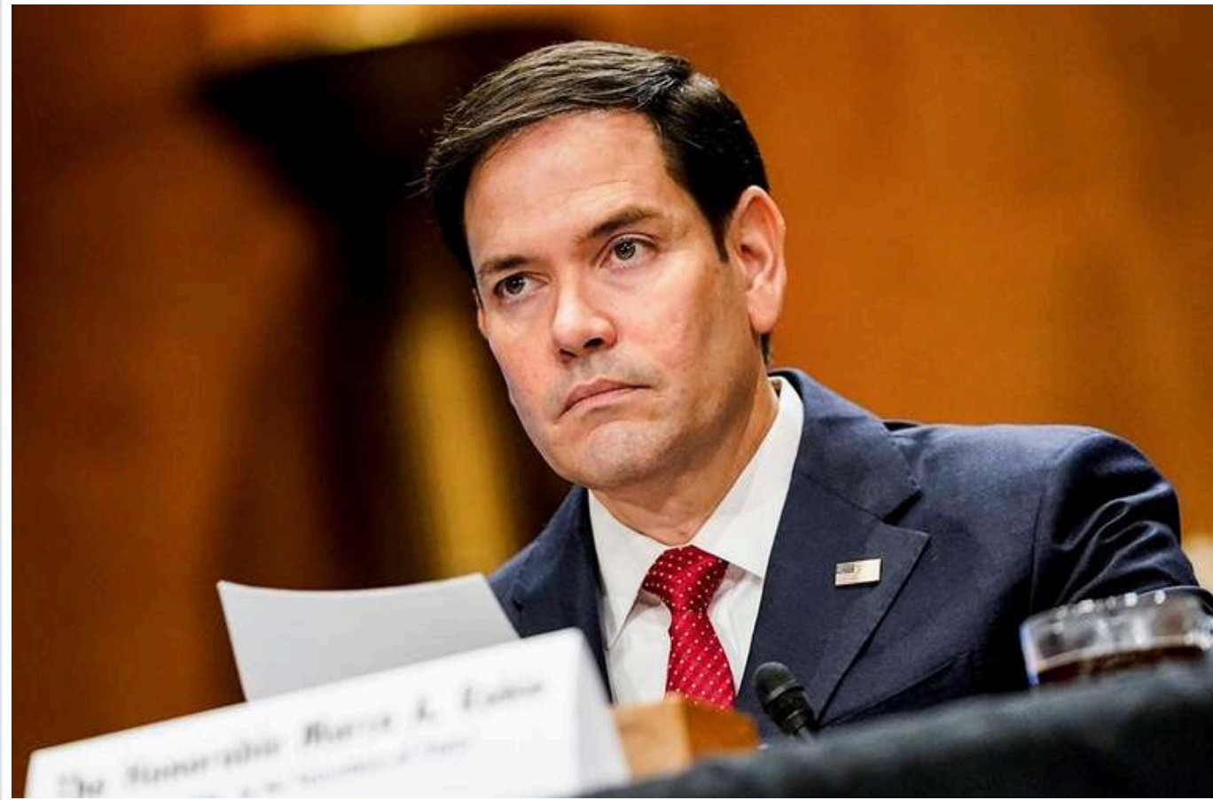
Рубіо заявив, що війна в Україні не має військового вирішення

Війна в Україні не має військового розв'язання, заявив держсекретар США Марко Рубіо в ефірі Fox News.