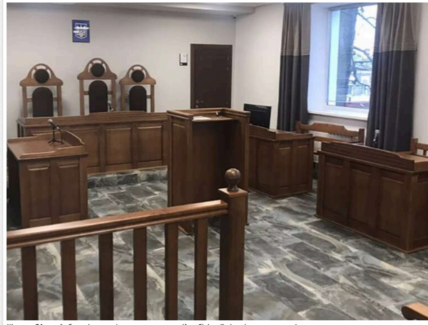
Жителя Одеської області оштрафували за ухилення від мобілізації після ігнорування повістки

Житель Одещини опинився у відділку поліції внаслідок перевірки документів. Правоохоронці виписали йому повістку до територіального центру комплектування, оскільки він не перебував на обліку в ТЦК, але цю вимогу він проігнорував.