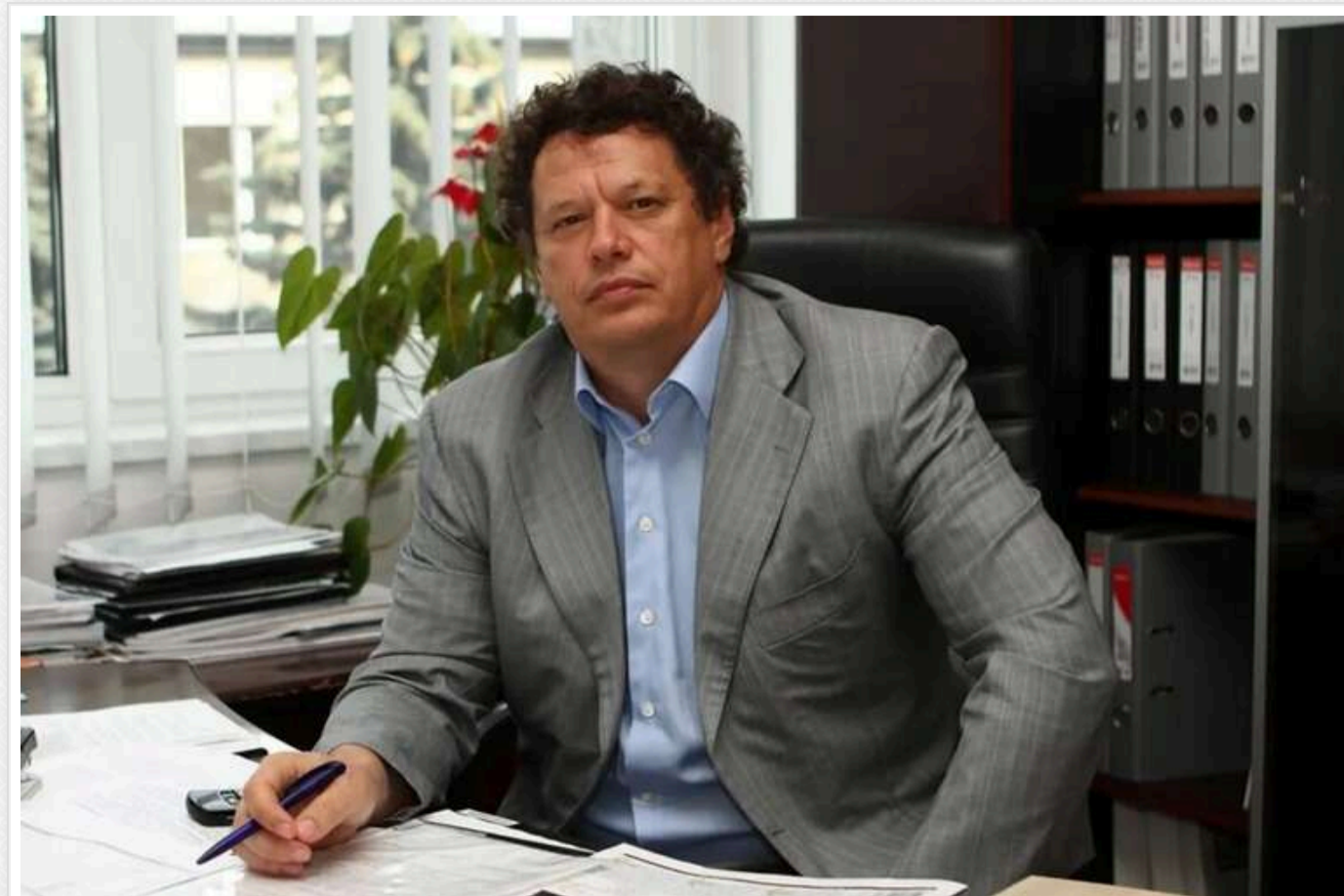
Справу тестя ексголови ДФС Насірова Глембовського, що стосується хабаря в 722 мільйони гривень, скеровано до суду, - САП

Читати на руском Read in English Додати як бажане джерело в Google