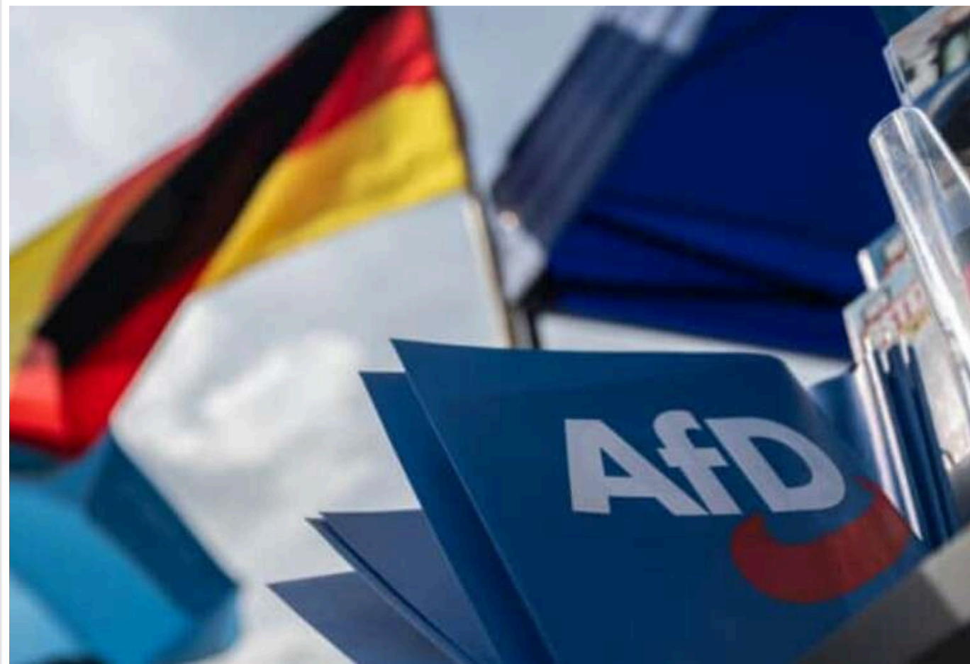
Шольц закликав не поспішати із заборною «Альтернативи для Німеччини», попри визнання її правоекстремістською

Канцлер, який йде у відставку, Шольц закликав не поспішати із заборною "Альтернативи для Німеччини", яку визнали «правоекстремістською».