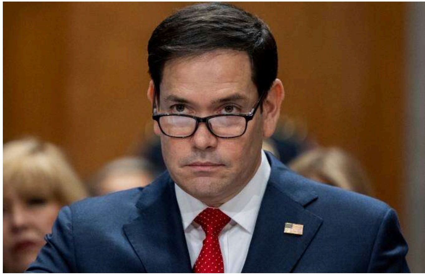
Рубіо анонсує «справжній прорив» у переговорах щодо України

В мирних переговорах щодо України незабаром необхідно досягти "значного прориву", щоб США продовжили брати участь у процесі, зазначив держсекретар Рубіо.