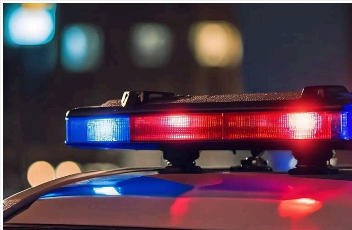
Поліцейська відволіклася на телефон і наїхала на дитину, - ЗМІ

Читати на русском Read in English Додати як бажане джерело в Google