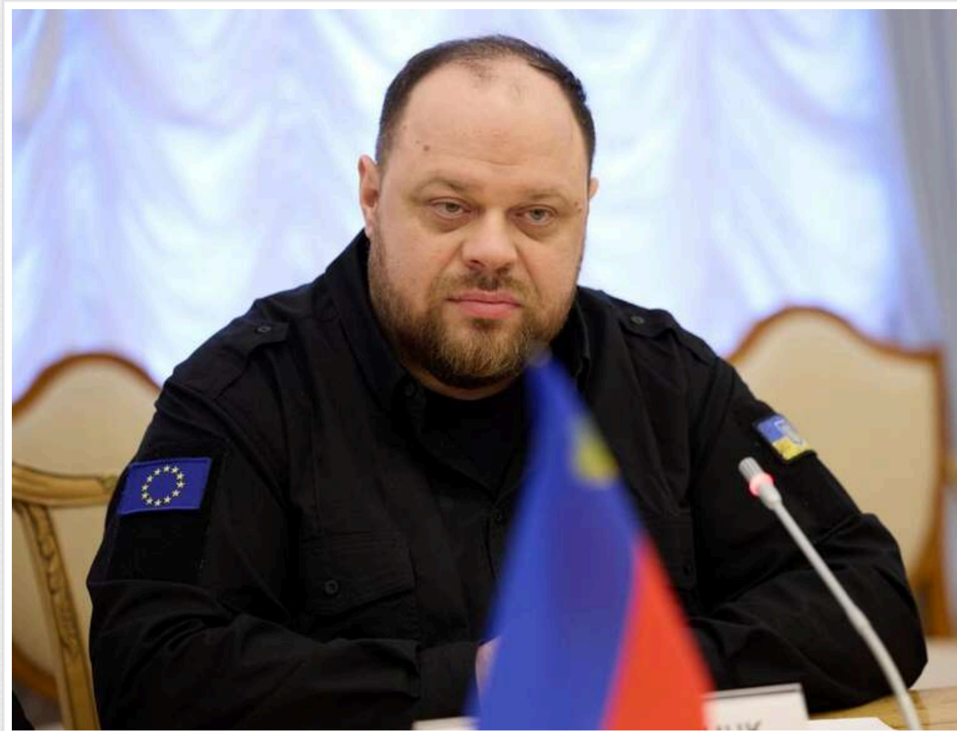
НАН відмовила Стефанчуку в званні члена-кореспондента, – ЗМІ