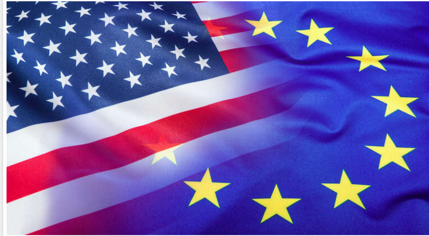
ЄС пропонує США підвищити обсяг закупівлі американських товарів на 50 мільярдів євро

Брюссель планує збільшити закупівлі американських товарів на 50 млрд євро, щоб вирішити "проблему" торговельних відносин зі США.