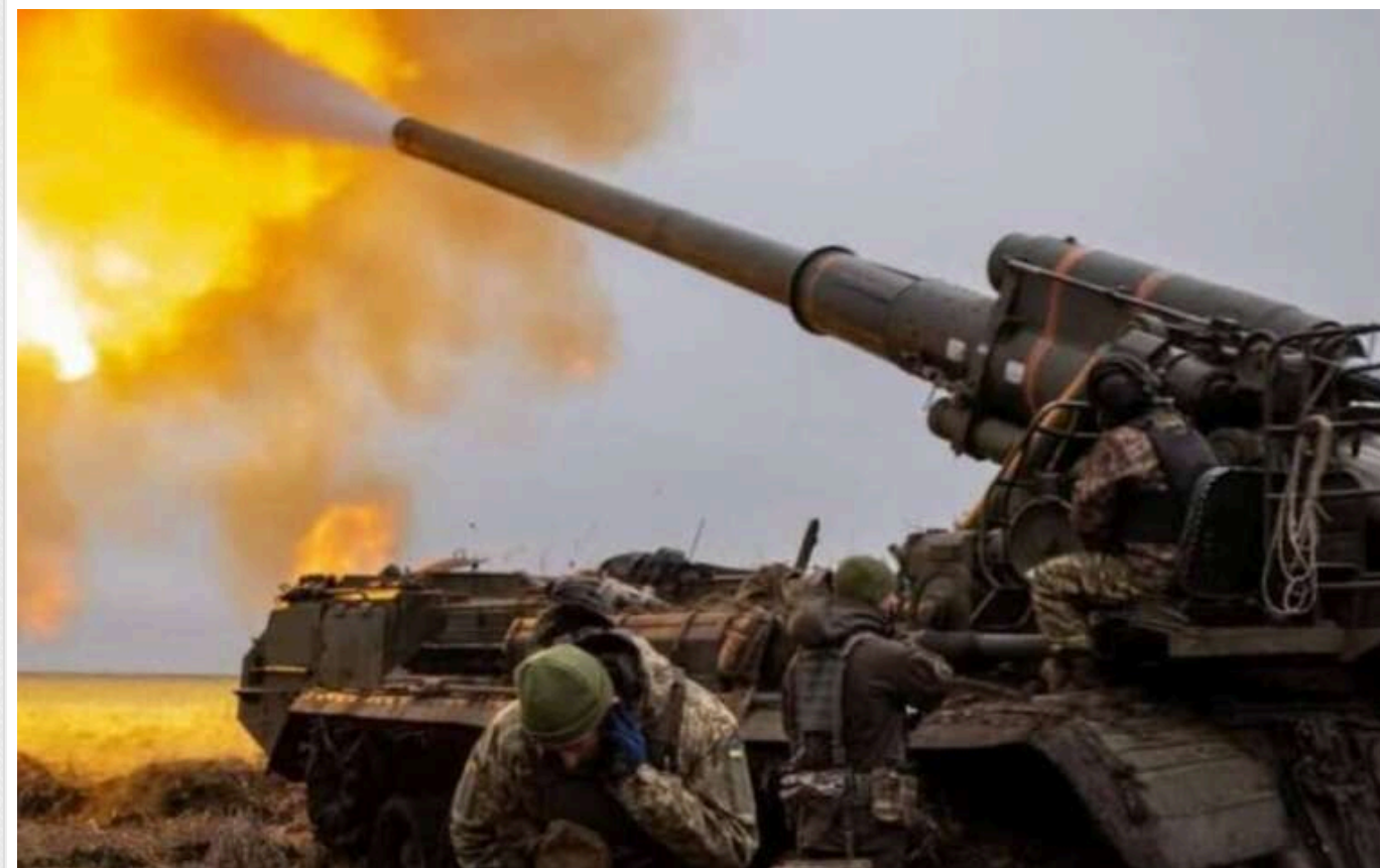
Артилеристи продемонстрували, як успішно знищують армію РФ на Херсонщині

Країна-агресорка й далі зазнає втрат на різних ділянках фронту. Українські військові щодня передають росіянам "цінні подарунки".