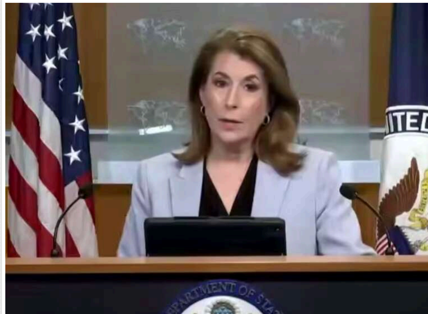
США відмовляються від ролі посередника в переговорах України та Росії, – Держдеп

Сполучені Штати більше не планують виконувати роль посередника в мирних переговорах між Україною та Росією.