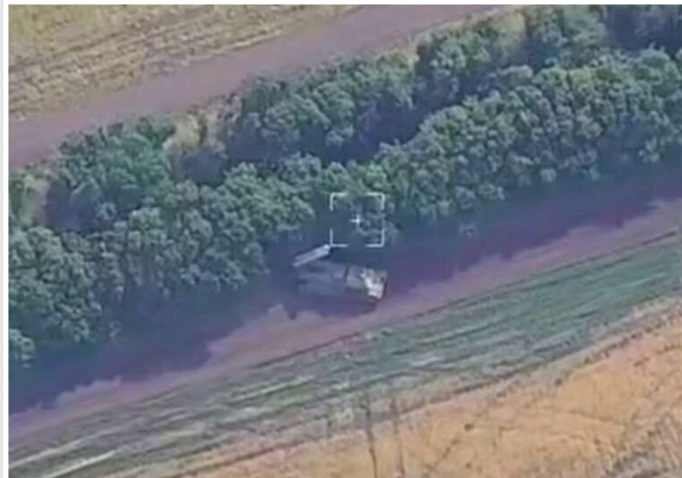
Розвідники "Чорного лісу" знищили російський ЗРК "Бук-М3" вартістю 45 мільйонів доларів

Розвідники бригади "Чорний ліс" знищили російську систему ЗРК "Бук-М3".