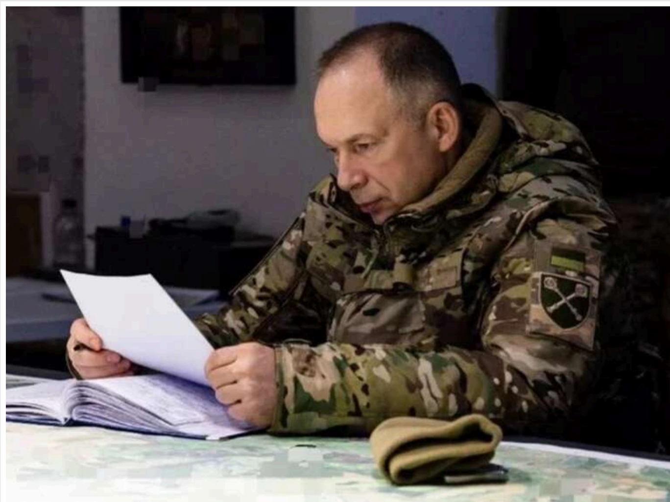
Кількість кримінальних правопорушень у ЗСУ за рік зменшилася майже наполовину, – Сирський

Читати на руском Read in English Додати як бажане джерело в Google