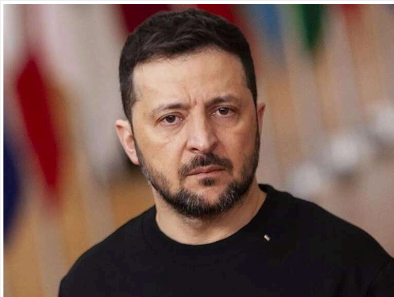
Зеленський: Що буде далі з угодою про економічне партнерство зі США

У четвер, 1 травня, Україна уклала угоду про економічне партнерство зі США. Тепер відповідні документи будуть направлені на ратифікацію до Верховної Ради.