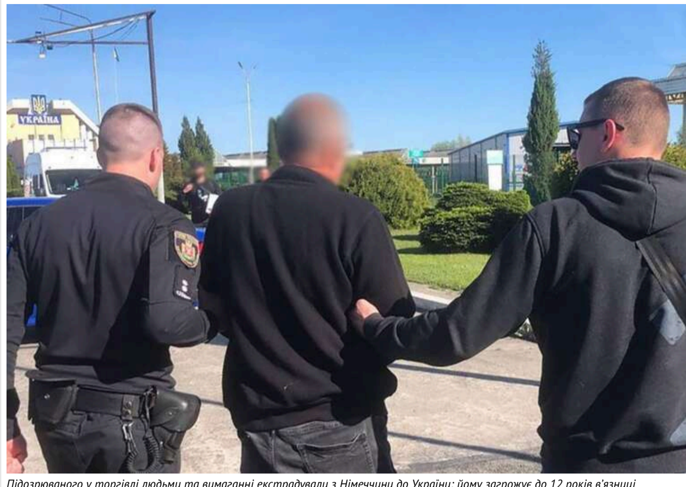
Підозрюваного у торгівлі людьми та вимаганні екстрадували з Німеччини до України: йому загрожує до 12 років в'язниці

Читати на руськом Read in English Додати як бажане джерело в Google