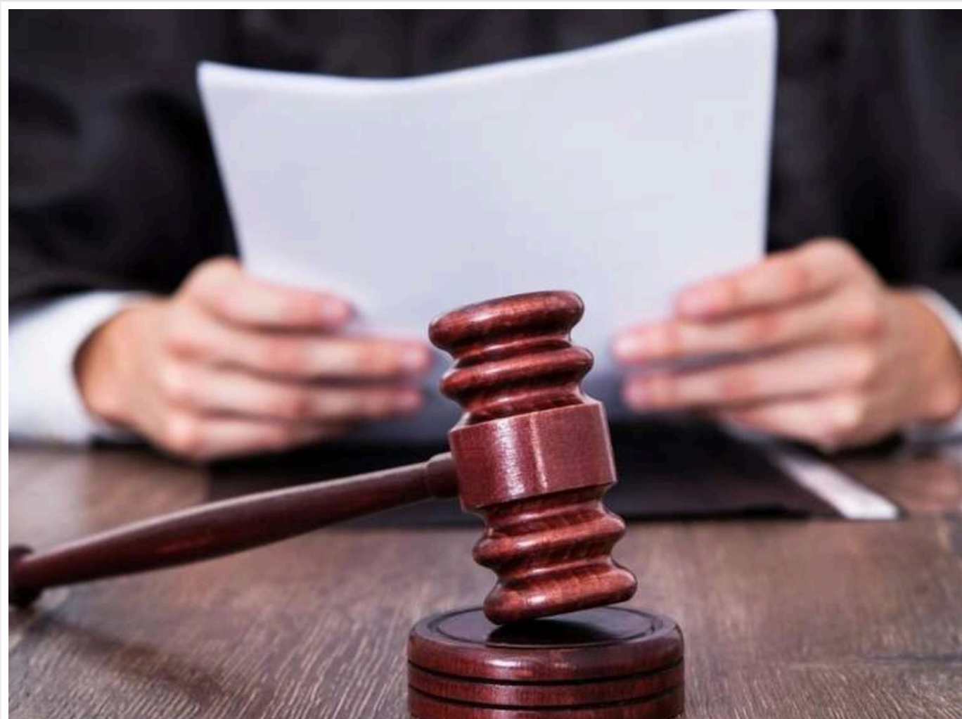
Верховний Суд: Під час дії воєнного стану релігійні переконання не є підставою для звільнення від військової служби

Читати на руском Read in English Додати як бажане джерело в Google