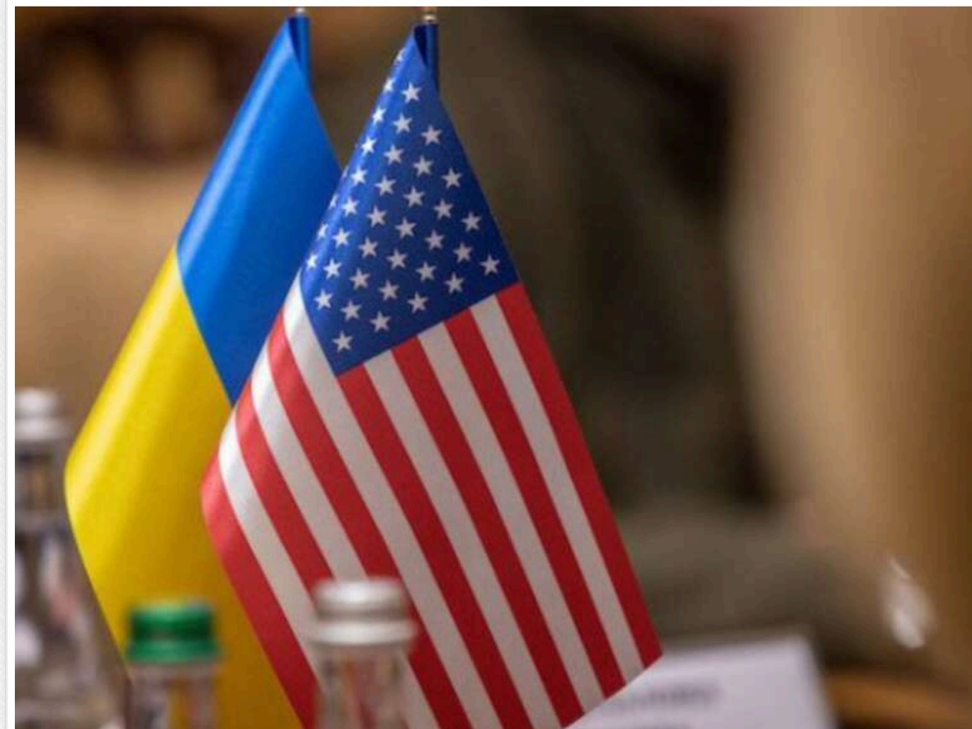
Угода зі США щодо надр матиме пріоритет над законами України - Железняк

Підписана Україною угода зі США щодо надр передбачає домінування американських умов і обмежує суверенне право держави регулювати власне законодавство у сфері інвестицій та природних ресурсів.