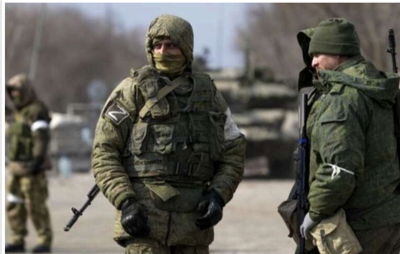
СБУ заочно оголосила підозру чотирьом колаборантам - катам ЗСУ в Луганській області: катували полонених струмом і кийками

Служба безпеки України заочно оголосила про підозру чотирьом колаборантам, які катували полонених воїнів ЗСУ на тимчасово окупованій території Луганщини.