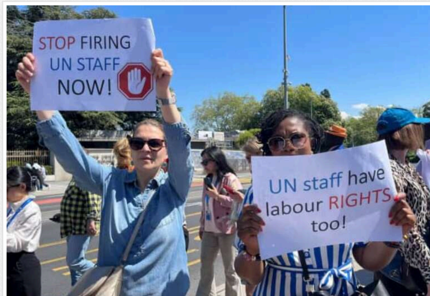
У Женеві співробітники ООН влаштували страйк через скорочення на тлі політики Трампа

У четвер, 1 травня, сотні працівників Організації Об'єднаних Націй організували акцію протесту біля європейської штаб-квартири ООН у Женеві, щоб висловити обурення скороченнями робочих місць, викликаними значним урізанням гуманітарної допомоги з боку президента США Дональда Трампа та інших донорів.