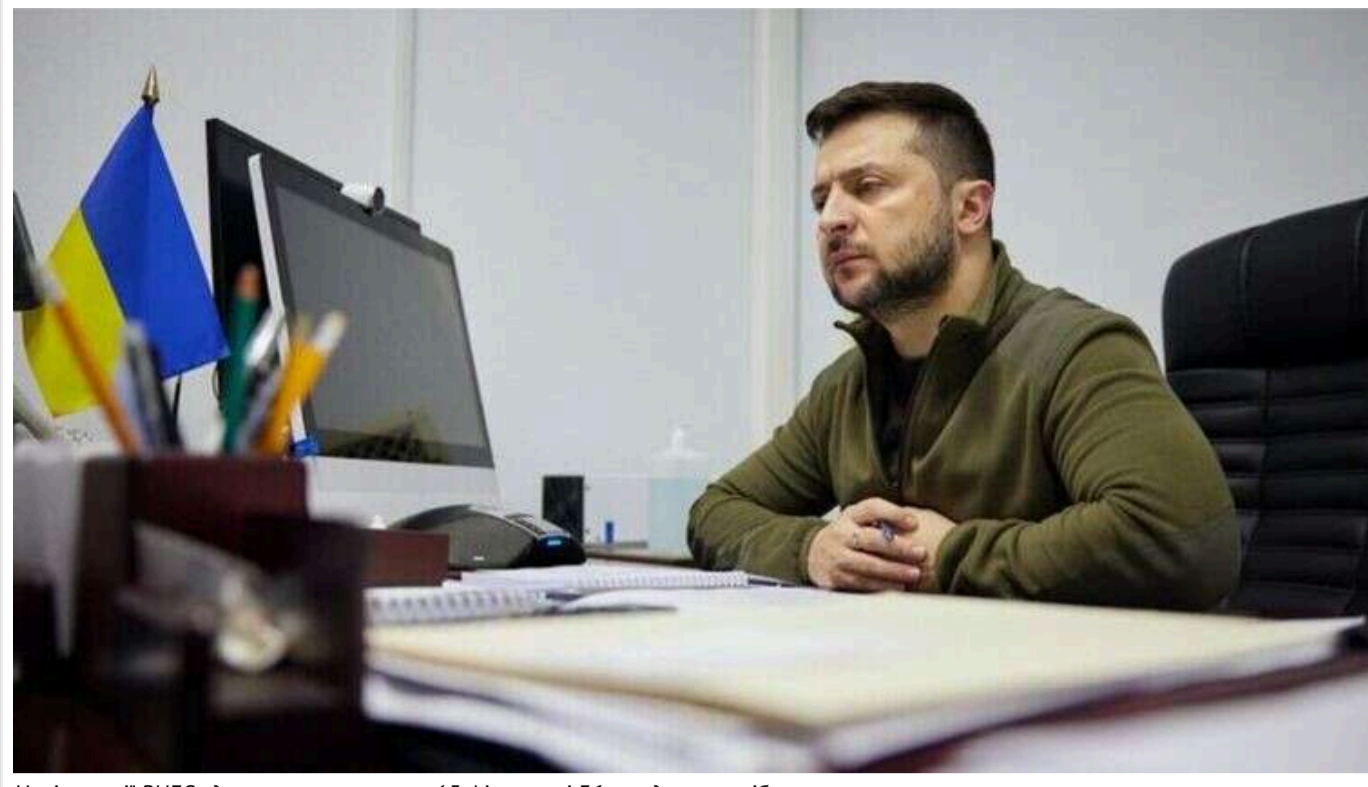
Нові санкції РНБО: до списку потрапили 15 фізичних і 36 юридичних осіб

Читати на руськом Read in English Додати як бажане джерело в Google