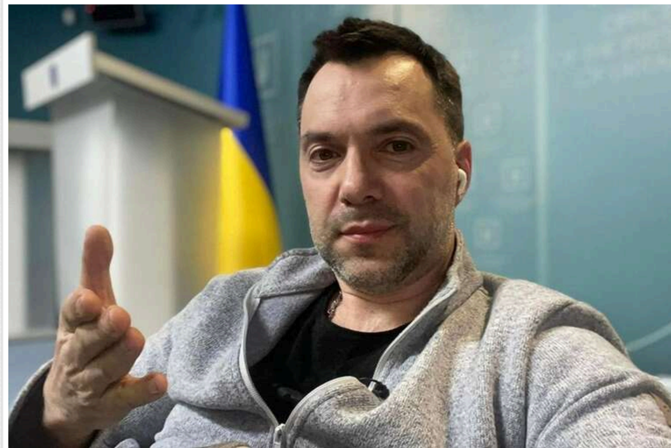
Зеленський ввів у дію нові санкції РНБО: у списку Арестович, Олешко, Бондаренко та інші

Указом Зеленського запроваджуються санкції РНБО проти Арестовича, Олешка та інших.