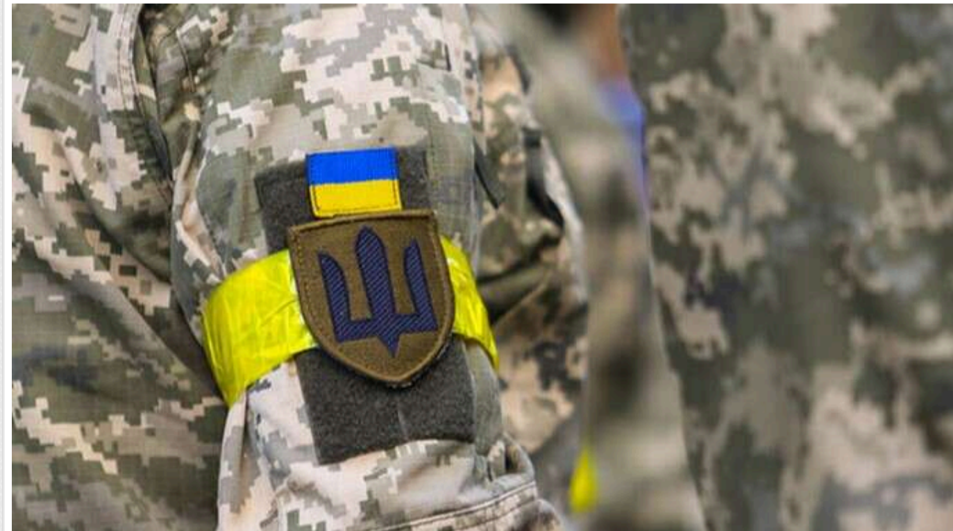
«Сина забрав ТЦК, а вдома залишилася замкнена психічно хвора мати»: деталі скандального випадку у Вінниці

Жінка відмовлялася їсти, тому швидка, поліція і сусіди відвезли її до психоневрологічної лікарні, проте нікому забрати її звідти.