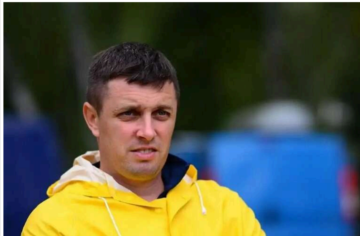
Теща чиновника Мінмолодспорту отримала понад 16 мільйонів гривень за тендерами для зимових видів спорту

Читати на руськом Read in English Додати як бажане джерело в Google