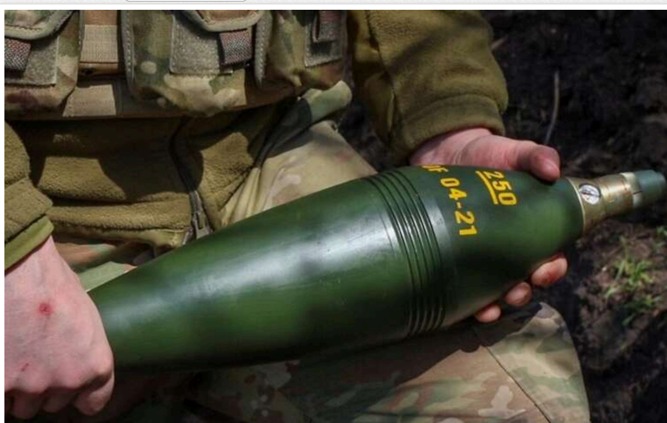
Міни, які не вибухають: як браковані боеприпаси опинилися на фронті - і чому досі не покарані всі винні

120 тисяч мінометних пострілів, поставлених на фронт, виявилися непридатними до використання. Про це офіційно повідомила Служба безпеки України.